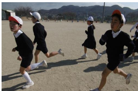
力強く走りきる山手っ子