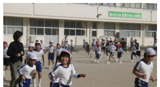
楽しく取り組む山手っ子