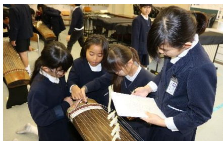
協同学習 音楽科での「琴」に取り組む様子

新しい年に向けて、さらに目標を掲げてがんばっていきたくないと、職員一同気持ちを新たにしております。子どもたちにとっても、保護者の皆様にとっても、元気で楽しい充実した年末・年始になりますように願っております。どうぞよいお年をお迎えください。